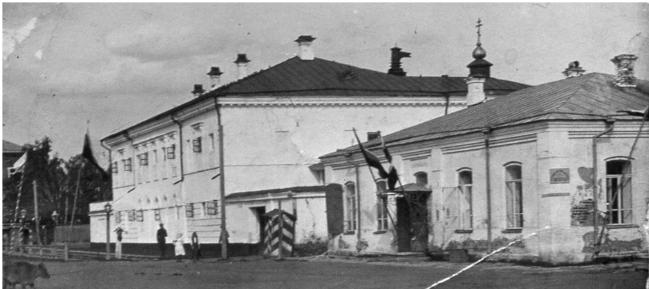
Фото 1. Пересыльная тюрьма и уездное казначейство.

На фотографии, датированной, предположительно, 1913-1917 годом, запечатлено двухэтажное здание пересыльной тюрьмы уездного города Красноуфимска и одноэтажное здание уездного казначейства. В настоящее время в этих зданиях находятся учебный корпус и столовая ГАПОУ СО «Красноуфимский многопрофильный техникум».