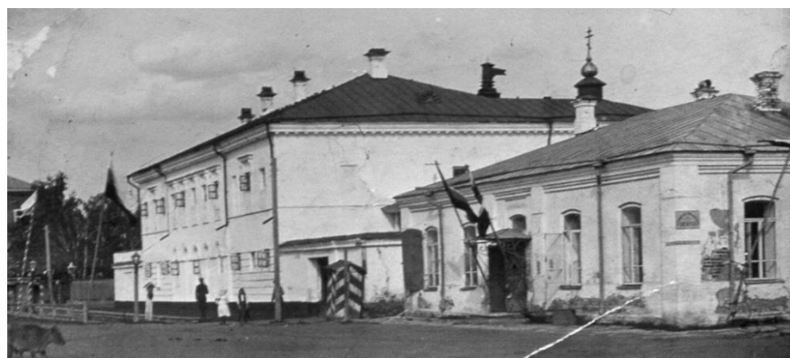
ФОТО 5. Пересыльная тюрьма (тюремный замок)

На фотографии начала 20-го века мы видим на крыше тюремного замка купол с крестом. Из документов, хранящихся в гор. архиве Красноуфимска следует, что при тюремном замке, в 1913 году, была устроена придомовая церковь Александра Невского (не путать с главной