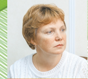
Кафедра физического воспитания и спорта