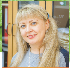
Кафедра физико-химической технологии защиты биосферы

Кафедра технологий целлюлозно-бумажных производств и переработки полимеров