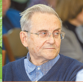
Кафедра общей физики