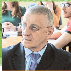
Кафедра интеллектуальных систем