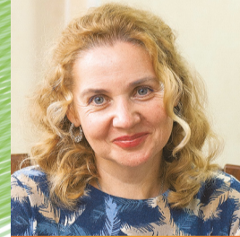
Кафедра социально-гуманитарных дисциплин