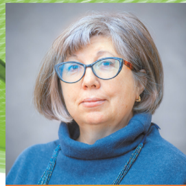
Кафедра химической технологии древесины, биотехнологии и наноматериалов